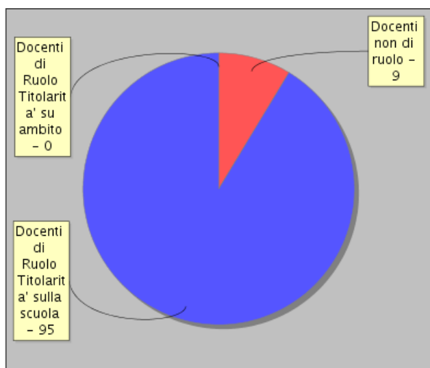
Distribuzione dei docenti per tipologia di contratto